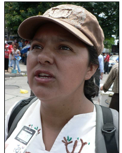
Bertha Cáceres, coordinadora nacional del Consejo Cívico de Organizaciones Populares e Indígenas de Honduras (COPINH).

La directiva del COPINH denunció también que muchos de estos proyectos turísticos son supuestamente financiados por organismos financiaron internacionales y la cooperación internacional. “La verdad es que son préstamos, así que al final es siempre el pueblo a financiar proyectos que hacen más ricos a los ricos y más pobres a los pobres. Hemos comprobado y somos testigo de cómo el BID y el BM han pretendido impulsar la titulación individual de la tierra, cuando ya existe